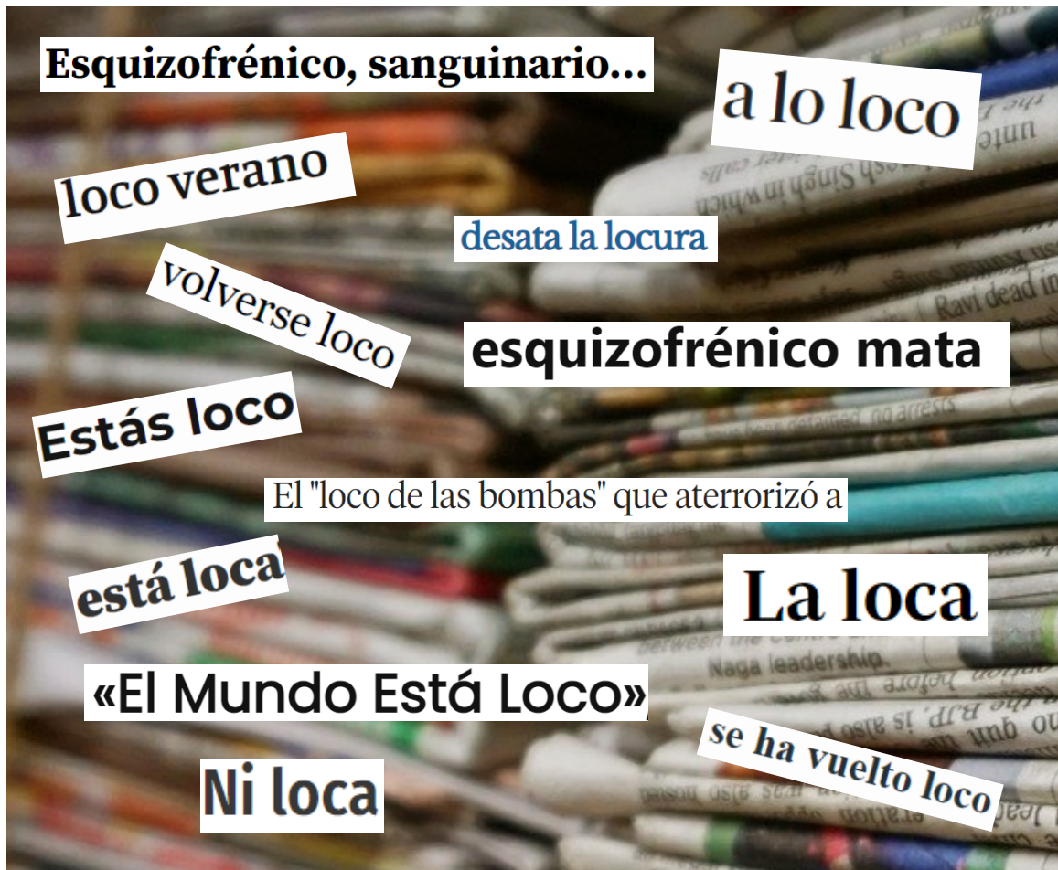
RECORTES DE TITULARES REALES UTILIZADOS CON FRECUENCIA POR LOS MM.CC.